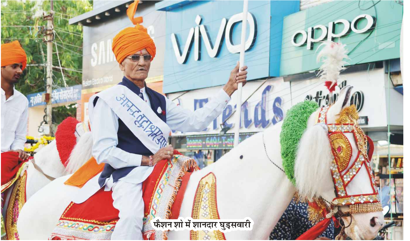
फैशन शो में शानदार घुड़सवारी

“तारा संस्थान” उदयपुर और देश के विभिन्न स्थानों पर आनंद वृद्धाश्रमों के नाम से निःशुल्क वृद्धाश्रम संचालित करता है। हमारा मुख्य उद्देश्य निःसहाय और जरूरतमंद बुजुर्गों को आश्रय प्रदान करना है। यहाँ पर देशभर से आए हुए अनेक वृद्ध निवास करते हैं, जिन्हें हम पूरी तरह से निःशुल्क रहना, खाना और चिकित्सा सहायता प्रदान करते हैं। हम उन्हें न केवल आवास प्रदान करते हैं, बल्कि उनकी रोजमर्रा की जरूरतों के लिए भी सेवाएँ सुनिश्चित करते हैं।