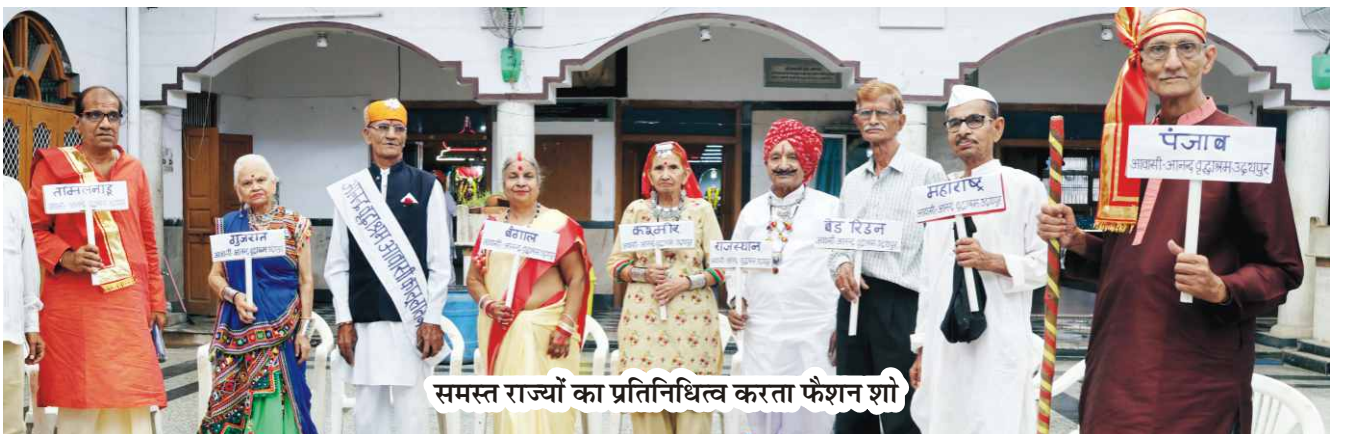
समस्त राज्यों का प्रतिनिधित्व करता फैशन शो

हाल ही में हमने एक फैंसी ड्रेस शो और अंतरराष्ट्रीय योग दिवस की तैयारी का आयोजन किया है। इन अवसरों पर भी सभी बुजुर्गों ने उम्र के ख्याल किए बिना एकजुट होकर उत्साह और जोश के साथ इन कार्यक्रमों में भाग लिया। फैंसी ड्रेस शो में वृद्ध लोगों ने अपनी पसंद के अनुसार अलग-अलग तरह की पोशाकें पहनीं और रैंप पर अपना जलवा दिखाया। ऐसे आयोजन उनके लिए मनोरंजक और रंगीन अनुभव साबित होते हैं।